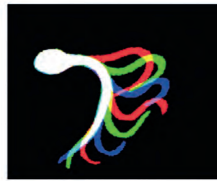
Schlagmuster des Schwanzes ein- und desselben Spermiums, entstanden durch Überlagerungen der Aufnahmen einer Hochgeschwindigkeitskamera (250 Bilder pro Sekunde). Links ist das typisch symmetrische, normale Schlagmuster zu sehen. Nach der Zugabe des UV-Blockers 4-MBC wird die Bewegung asymmetrisch (rechts).

Bilder (li.): aus: Schiffer et al. (2014): Direct action of endocrine disrupting chemicals on human sperm. EMBO Reports 15(7), 758-765; Illustration: Mario Mensch